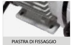
PIASTRA DI FISSAGGIO