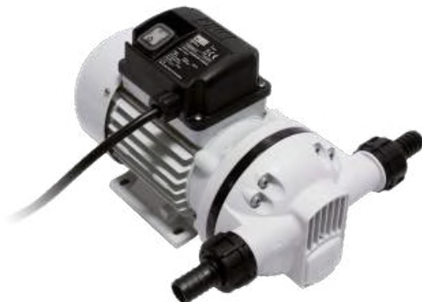
SUZZARABLU PUMP AC